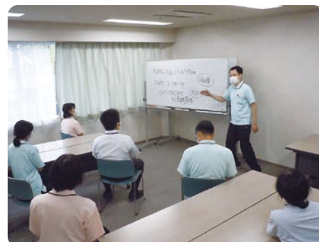
はなかいどうの内部研修

身体拘束適正化研修では、今までの研修を振り返りながら、グループで拘束になりえる事例について考え、原因と解決方法を話し合いました。職員からは「研修を通して様々な視点で考えられるようになり、業務の中で対応の選択肢が広がった」という声も聞かれています。