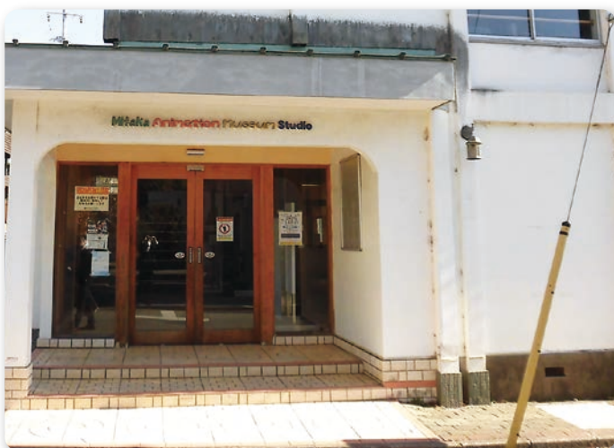
三鷹アニメーションミュージアムスタジオ