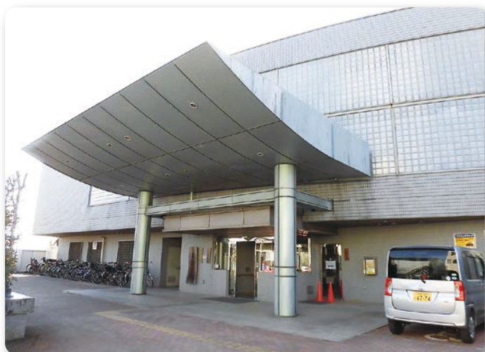
旧どんぐり山施設