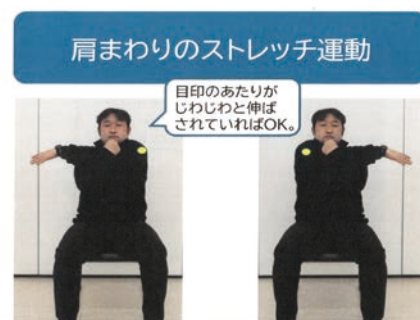
肩まわりのストレッチ運動